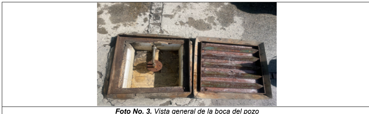
Foto No. 3. Vista general de la boca del pozo

Durante la verificación en campo se puede determinar que, en relación con las condiciones físicas del pozo, este cuenta con tubería de niveles y tubería de producción en buenas condiciones; la boca del pozo está dentro de una estructura de concreto con baldosas blancas con superficie cubierta, que evita la manipulación por terceros. (Ver fotos No. 3), de igual manera se encuentra en buenas condiciones ambientales.